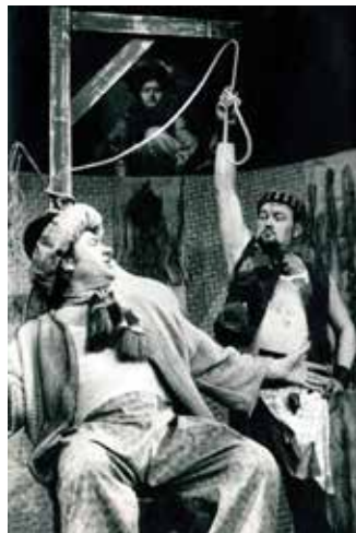
Jiří Mahen: Nasreddin (10. 4. 1974, Divadlo na Starém pivovaru)