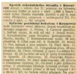
Představení Spolku ochotnického divadla „Lišák a Smola“ a oslavy Silvestra v Sokole (31.12. 1921)