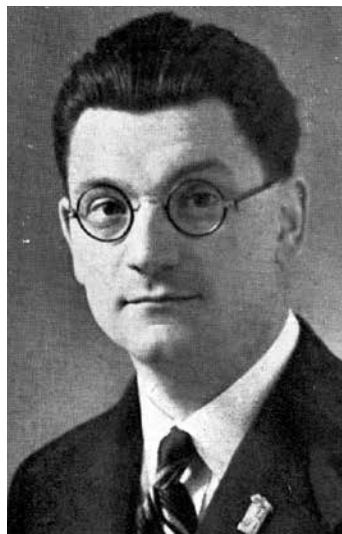
Jan Zahradníček (1902-1942)