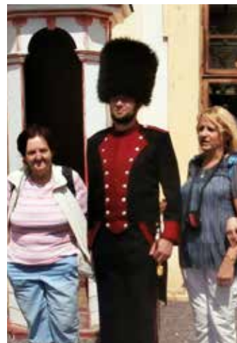
Už pouhé focení nových uniform vyvolalo před zámek velkou pozornost kolemjdoucích turistů, kteří si chtěli s gardou udělat společnou fotku. Právě tento cíl si nová atrakce radnice a skupiny historického šermu Biskupští manové klade.

Zajímavé uniformy se však staly středem zájmu turistů, o čemž svědčí řada fotografií z dob konce monarchie. Za finanční podpory města Kroměříže a pomoci Muzea Kroměřížska se podařilo skupině historického šermu Biskupští manové z Kroměříže zrekonstruovat vzhled gardy z přelomu 19. a 20. století, takže si budou moci návštěvníci našeho města během letních prázdnin opět pořídit atraktivní fotografii připomínající doby dávno minulé. Gardisté budou poprvé představeni na Středověkých slavnostech 7. června 2014, kde vystoupí také Sbor uniformovaných ostrořelců Kroměříž, se kterými gardisté spolupracovali i před 100 lety. Kroměříž tak získá další unikát, který nemá žádné jiné město – dvě dobové jednotky dokládající bohatou historii našeho města. (ep)