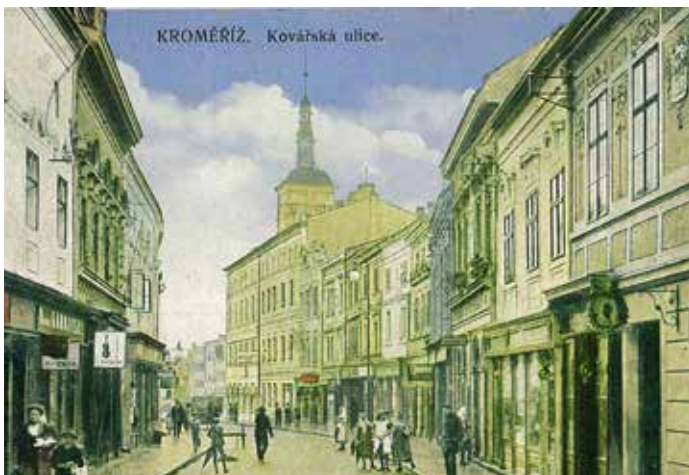
Kovářská ulice na pohlednici kolem roku 1906