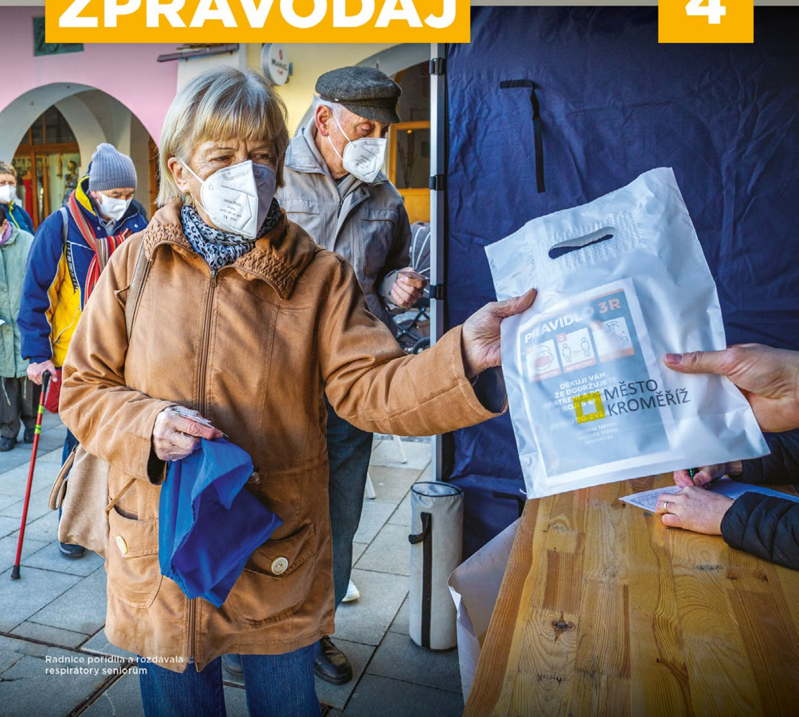
Radnice pořídila a rozdávala respiratory seniorům