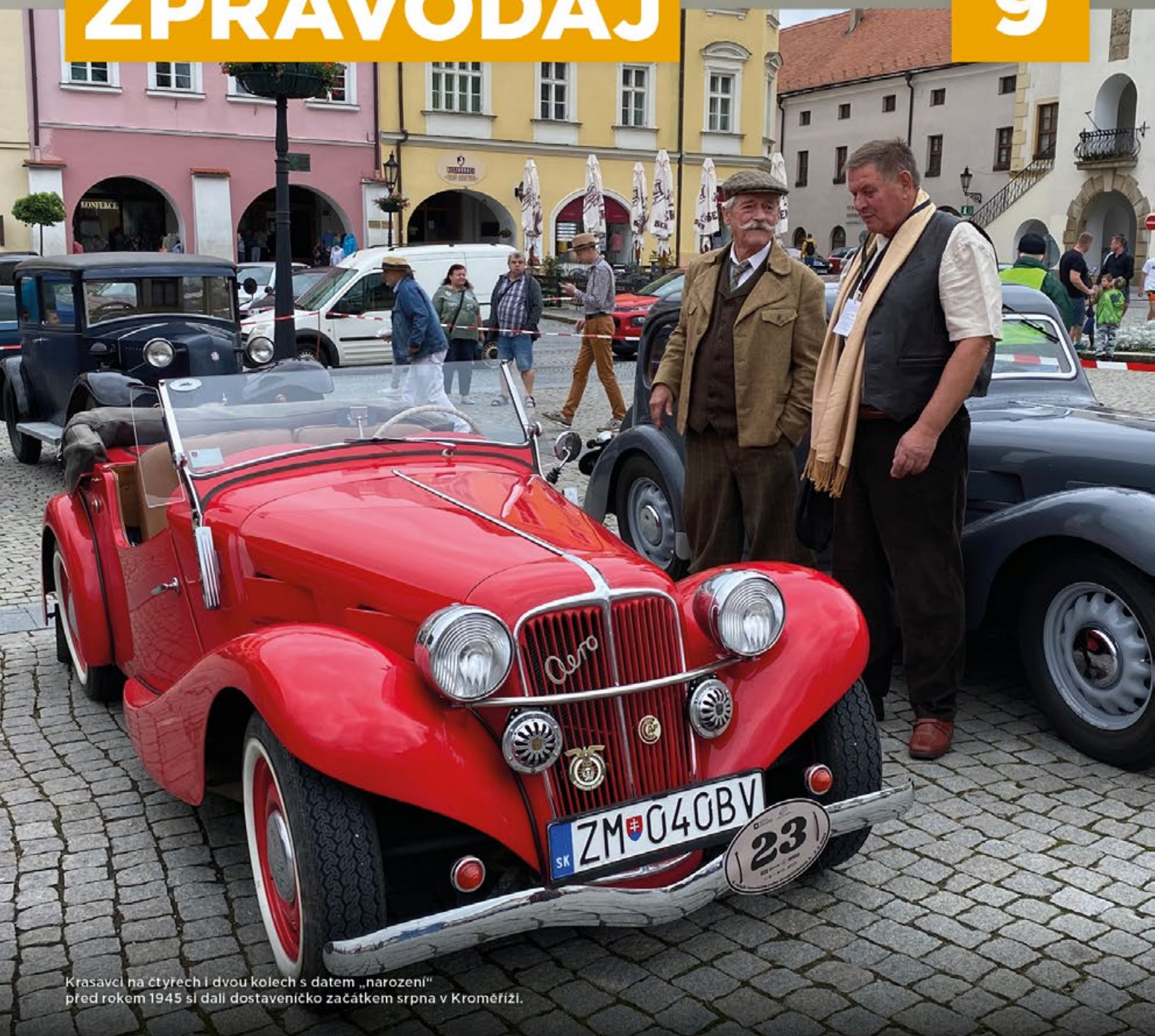
Krasavci na čtyřech i dvou kolech s datem „narození“ před rokem 1945 si dali dostaveníčko začátkem srpna v Kroměříži.