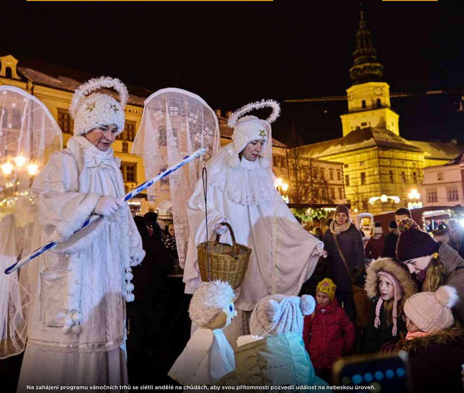
Na zahájení programu vánočních trhů se slétli andělé na chůdách, aby svou přítomností pozvedli událost na nebeskou úroveň.