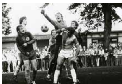
Na Rejdišti probíhaly boje o každý míč.