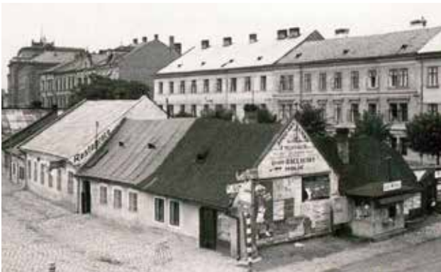
Ostrůvek domků na Husově náměstí v roce 1941.

kostela Panny Marie ležícího uvnitř městských hradeb a kostela sv. Trojice stojícího v blízkosti františkánského kláštera (později Octárny). Na nový hřbitov u silnice vedoucí do Kotojed (dnešní Bezručův park) byla použita zahrada výše zmíněného Reiterovského dvora, jehož budovy byly postupem času zbourány. Na hřbitově byla záhy postavena kaplička včetně dláždění s ozdobnou postříbřenou lampou. Již od počátku se nový hřbitov potýkal s nedostatkem místa, proto musel být v letech 1805, 1839 a 1858–1859 rozšířen. Ke změnám došlo také ve 2. polovině 19. století, kdy byla zvýšena hřbitovní zeď, postavena nová umrlčí komora a byl hrobař. Úprav se dočkala rovněž hřbitovní kaple, jež byla opatřena