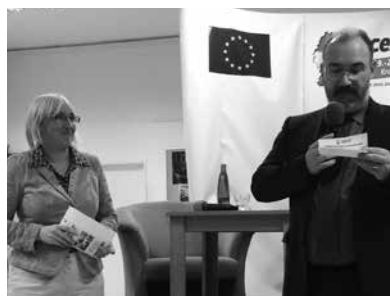
Europská poslankyně Olga Sehnalová a tajemník velvyslanectví Lucemburska v České republice Frank Biever