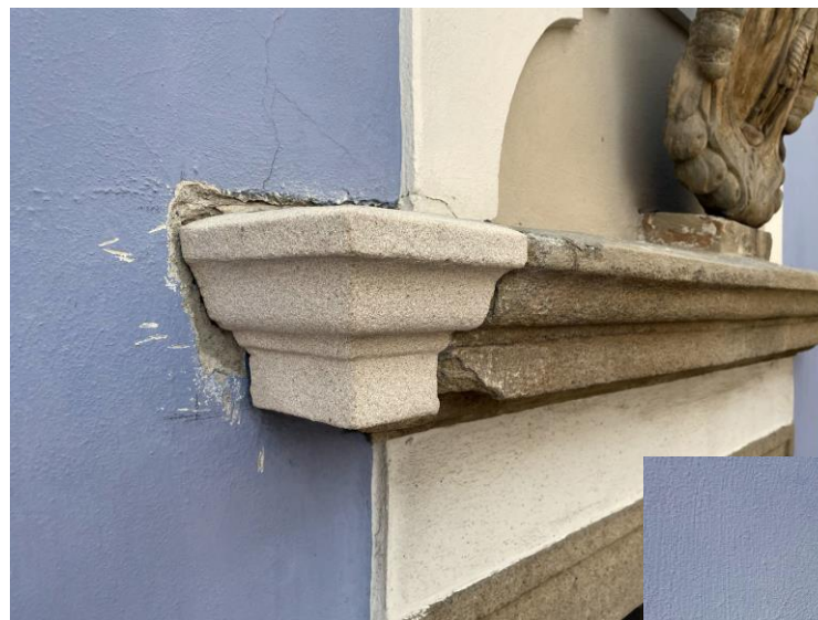
Detail římsy před a po doplnění vsatky z božanovského pískovce