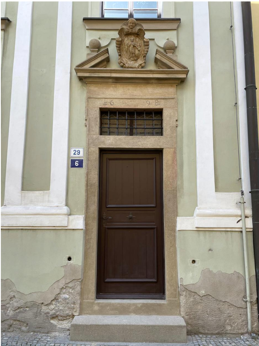
Celkový stav portálu po restaurování