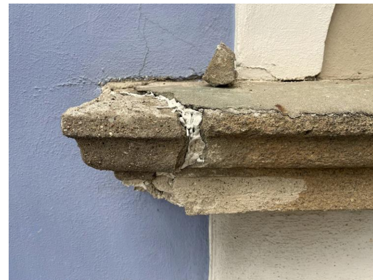
Celkový pohled a detaily před restaurováním kamenného portálu