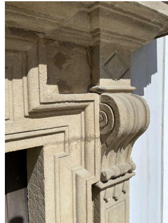
Celkový pohled a detaily před restaurováním kamenného portálu