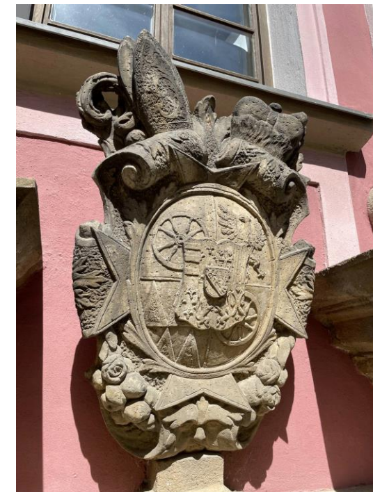
Restaurátorské práce na kamenném vstupním portálu budovy Celkový pohled a detaily před restaurováním