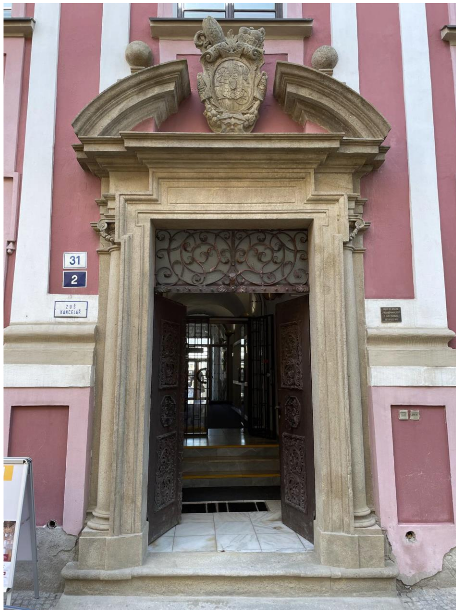
Celkový stav portálu po restaurování