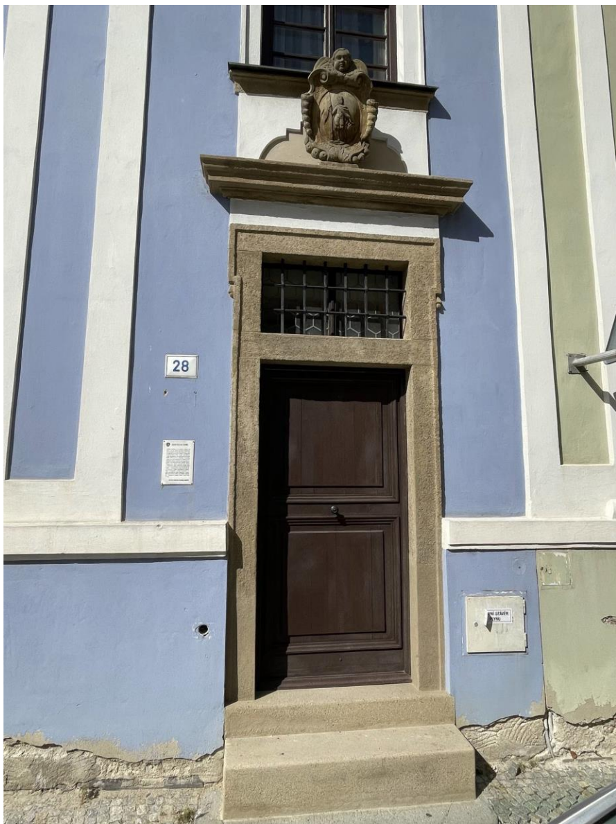
Celkový stav portálu po restaurování