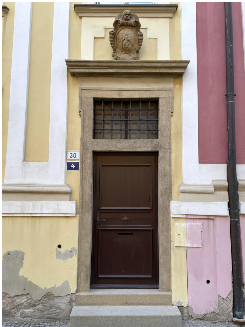
Celkový stav portálu po restaurování