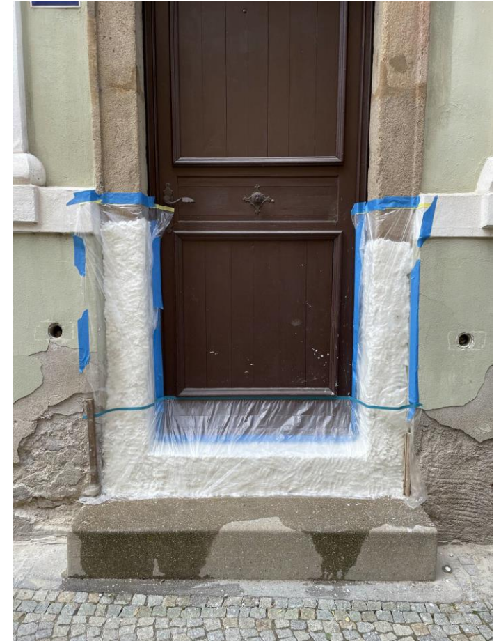
Celkový pohled před restaurováním, detail odsolení Restaurátorské práce na kamenném vstupním portálu budovy