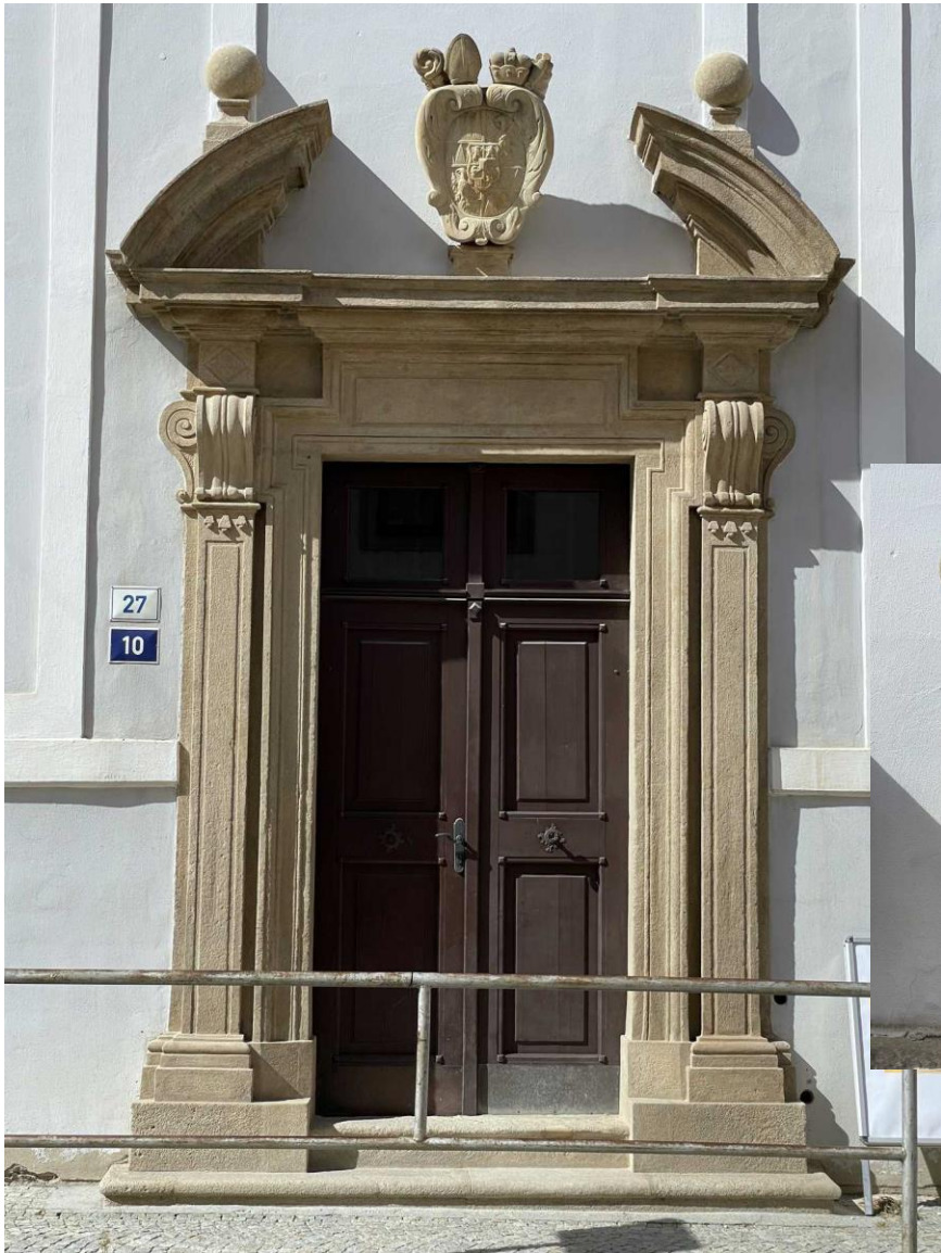
Celkový stav portálu po restaurování