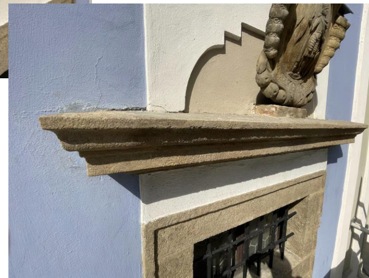
Celkové finanční náklady 60 tis. Kč