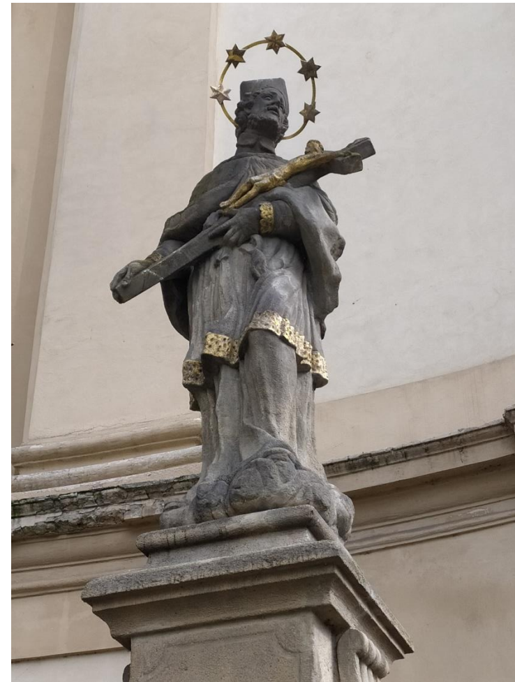
Původní stav sochy před restaurováním