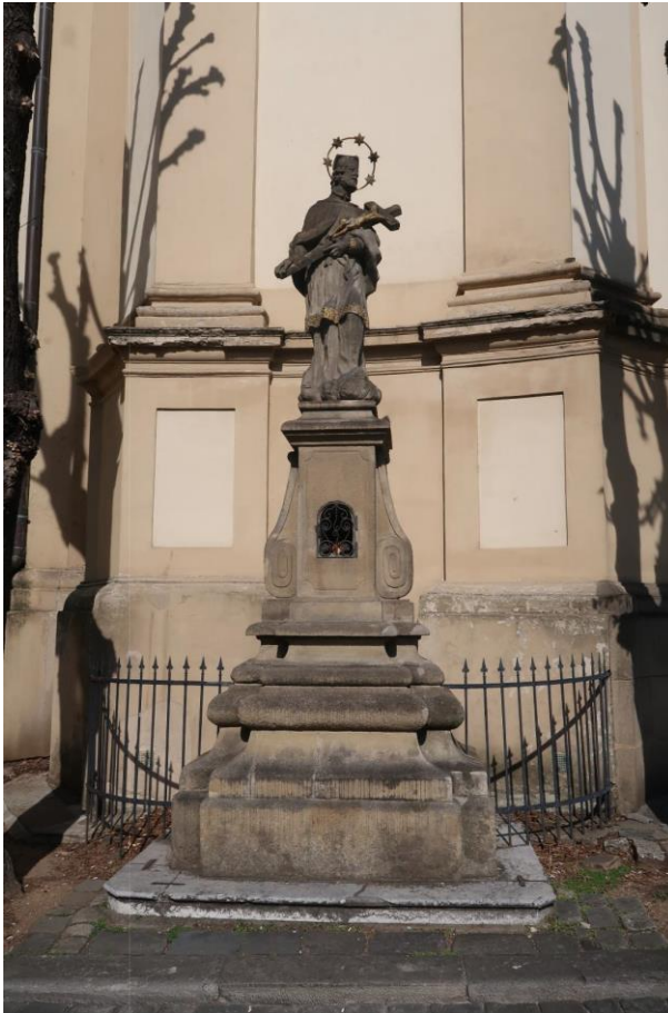
Původní stav sochy před restaurováním

Restaurátorský průzkum a záměr zpracovali: Ak. soch. René Tikal v 06/2022