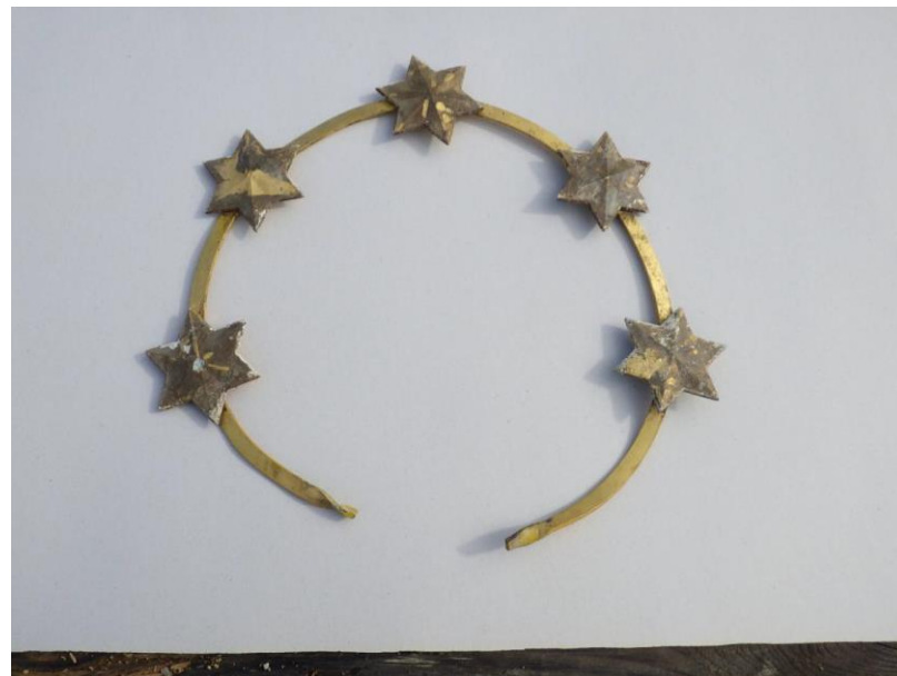
Detaily sochy před restaurováním