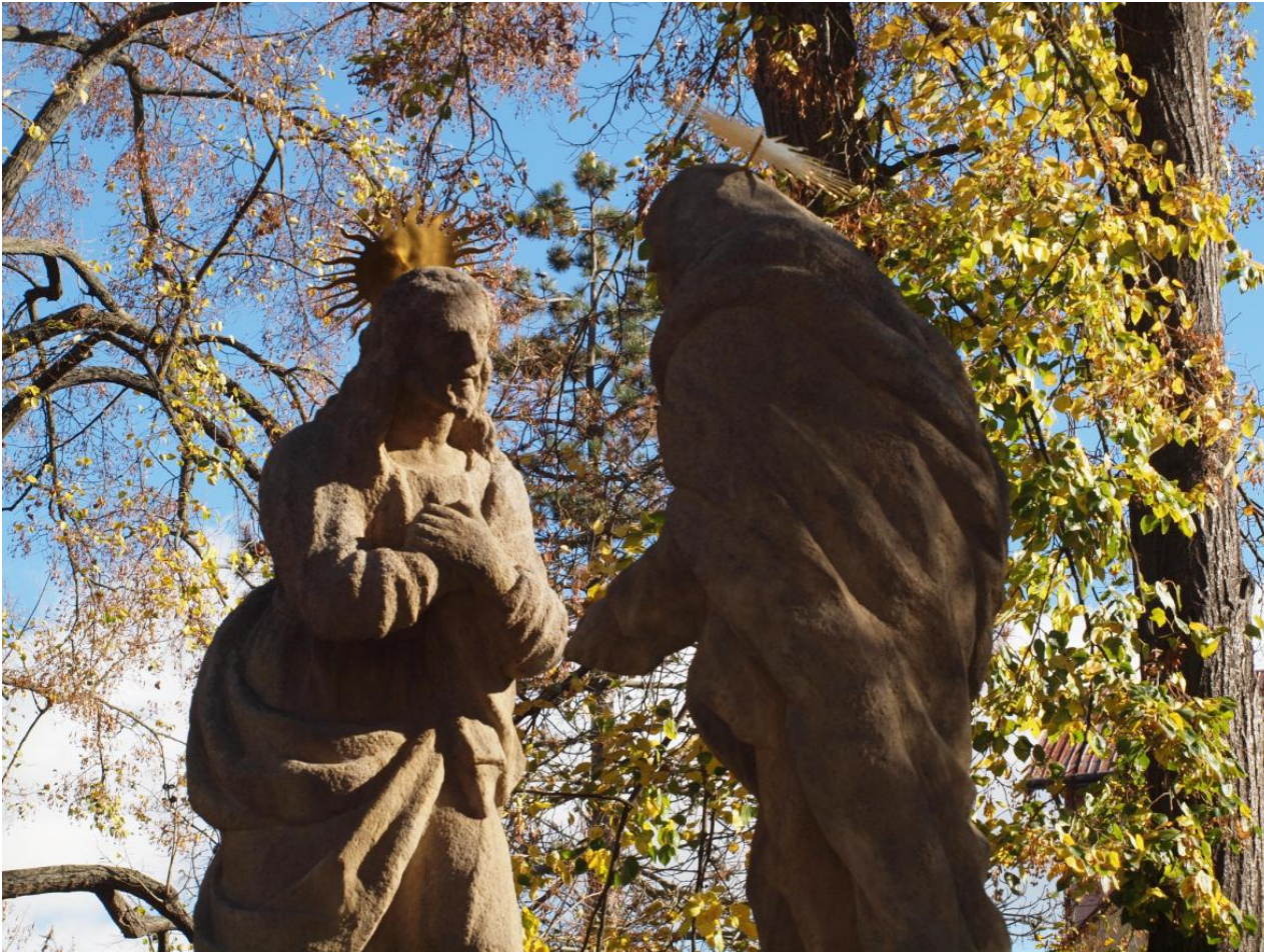
Detail sousoší po provedených restaurátorských pracích

rejstříkové číslo kulturní památky č. ÚSKP 29519/7-6020