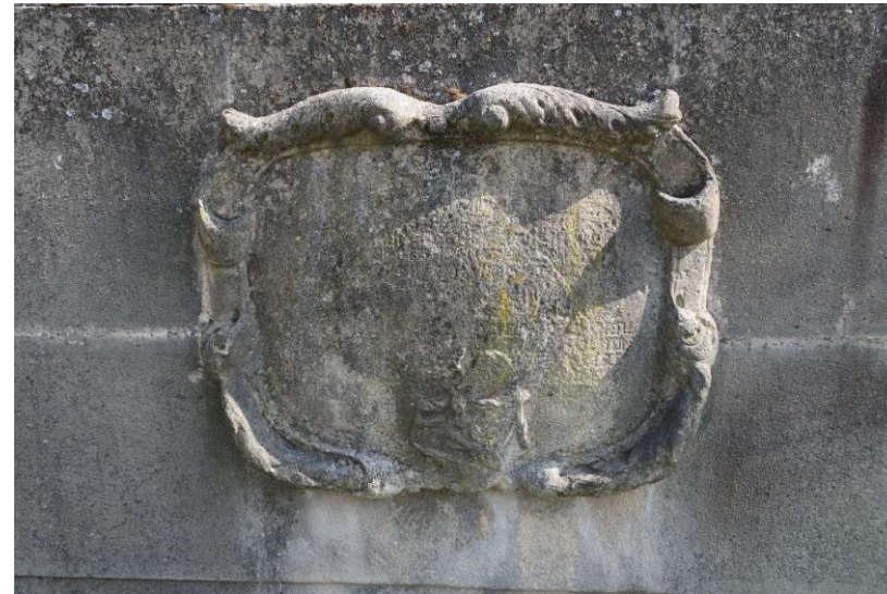
Původní stav sousoší před restaurováním

Sousoší se skládá z mohutného podstavce osazeného sochami Loučení Ježíše Krista s Pannou Marií.