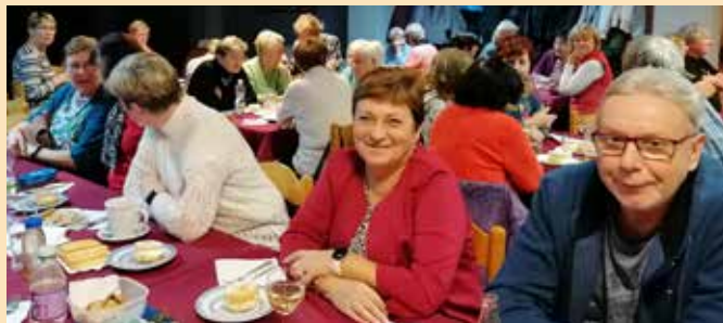
Klub českých turistů, odbor Kroměříž

náměstí. Rádi bychom do našich řad pozvali nové členy - ty, jimž chybí místo, kam mohou pravidelně či nepravidelně docházet, nenáročně se pohybovat a možnost sdílet radost z komunikace, nebo i mlčení ve skupině nekonfliktních osob. Přihlásit se je možné každou středu od 16.30 hodin v prostorách centra pro seniory na Hanáckém náměstí.