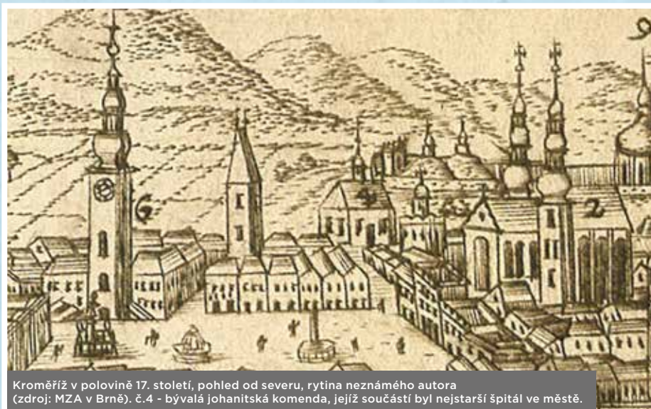
Kroměříž v polovině 17. století, pohled od severu, rytina neznámého autora. č.4 - bývalá johanitská komenda, jejíž součástí byl nejstarší špitál ve městě.

V období 16.-17. století se v českých zemích začaly objevovat špitály zakládané přímo městskými radami. Před rokem 1620 provozovalo město podle historika Peřinky dva špitály, jeden v Jánské ulici, druhý v Kovářské ulici u Kovářské brány. Prvně jmenovaný dostal od biskupa Mar-